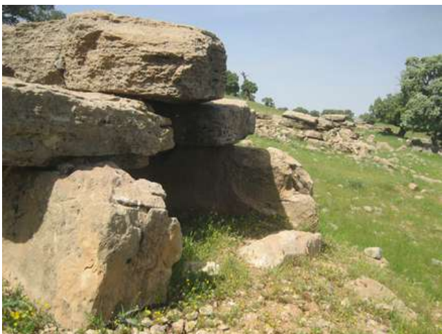
گورستان باستانی آهنگران در سیروان ایلام