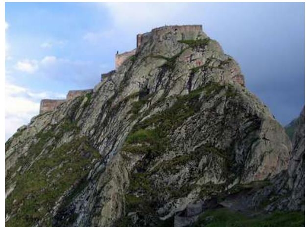
دژ نفوذناپذیر بابک خرم‌دین در کوهسار غربی کلیبر و نزدیک رود ارس

مزدکیان ایران در دوران پس از اسلام نیز بسان فرقه‌ای «باطنی» و بعدها در قالب «خُرمدینان» که «بابک» مشهورترین شخصیت آن بود، به حیات تاریخی خویش ادامه دادند و پرچمدار جنبشی نامدار علیه ستم عباسیان شدند که با وجود رشادت‌های ملی فراوان، سرانجام با همدستی مگاران و خائنان روزگار سرکوب شد.