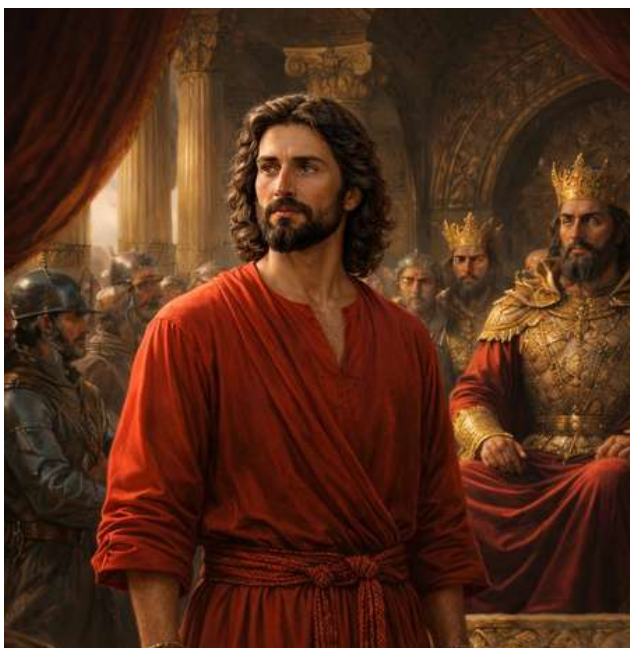
مزدک (تصویرسازی در آتلیه ویسپویش و AI)

از دیگر سو، مُغان نیز در این راه، همّتی تمام کردند تا مزدکیان را آشوب‌طلب و مُحارب بنمایانند. حال آنکه مزدک، علیه هزینه‌ی سنگین جنگ‌های ایران و روم و سیاست خصمانه‌ی خارجی، همچنین سیاست‌های غلط داخلی همچون تبعیض طبقاتی، مالیات‌های سنگین، شهوترانی بی‌پایان ثروتمندان در حرمسراها، فقر ناشی از سوءمدیریت و زیاده‌خواهی اشراف و استثمارگری مُغان شوریده و در پی اصلاحات مذهبی، در تلاش برای انقلاب عمیق اجتماعی بود.