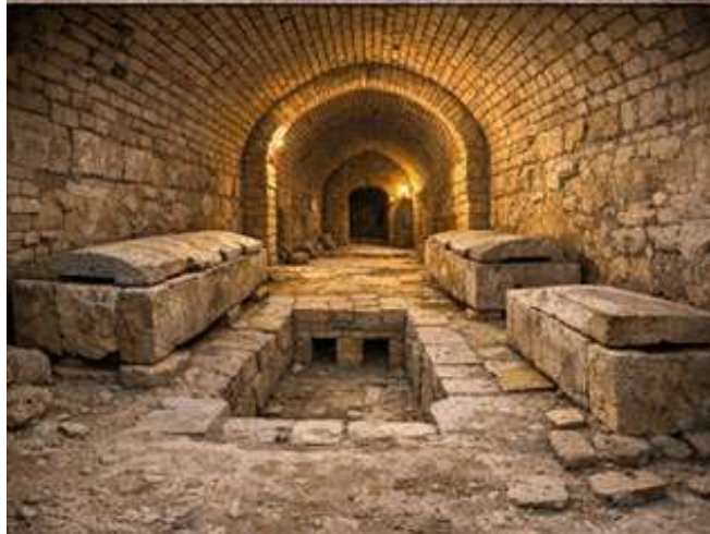
مقبره‌های زیرزمینی چغازنبیل (بازآفرینی تصویری از AI در آتلیه ویسپوویس براساس تصاویر اصلی)

از کاوش‌های هفت‌تپه، آثاری پراکنده از نقاشی دیواری به صورت قطعات گلی منقوش نیز به دست آمده که احتمالاً در هنگام ویرانی بنا فرو ریخته‌اند. بیشتر این نقوش هندسی به رنگ‌های آبی، نیلی، قرمز، نارنجی، زرد، خاکستری، سیاه و سفید هستند و سه شیء مهم، شامل سردیس یک مرد و یک زن ایلامی و ماسک چهره‌ی یک مرد نیز در میان آنهاست. تابوت‌هایی هم در این معبد کشف شده که از جنس سفال و در ابعاد و اندازه‌های مختلفی هستند.