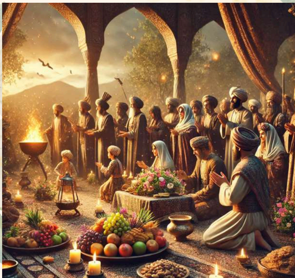
تصویر ساخته شده توسط AI، برای جشن بهمن‌گان در آتلیه ویسپویش

این نگاه، ضمن آنکه نشان می‌دهد ایرانیان عموماً حامی طبیعت و حیوانات بوده‌اند، می‌تواند مناسبتی ویژه برای حامیان حیوانات و محیط زیست نیز دانسته شود. به همین دلیل، انجمن حمایت از حیوانات ایران،