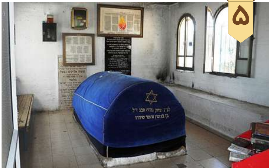
آرامگاه حبقوق نبی در کاداریم اسرائیل