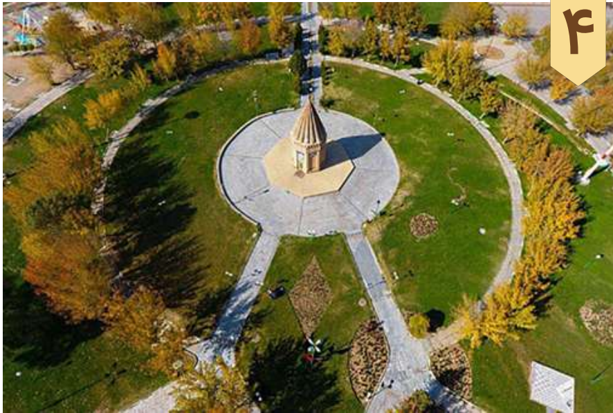
نمای هوایی از آرامگاه حبقوق نبی در تويسرکان

تویسرکان گَمْز جیو go maz ji yo یعنی گنبد جهودان (یهودیان) نامیده می‌شد (صفحه اینستاگرام تويسرکان قدیم، @touyserkan_ghadim) و سنگ بنای آرامگاه کنونی مربوط به دوره سلجوقی و حوالی سده‌های پنجم و ششم هجری است که بارها از جمله آخرین بار در سال ۱۳۵۶ مورد بازسازی قرار گرفته است. گنبد این بنا بصورت رُک مخروطی ساخته شده و صندوق تابوت آن نیز نوشته‌هایی به زبان‌های عبری و فارسی دارد.