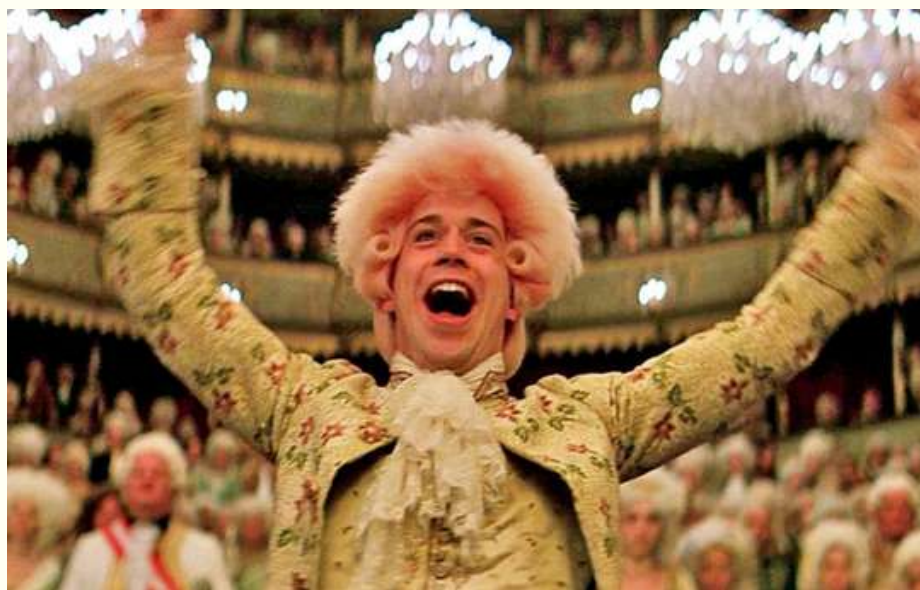
نمایی از موتسارت در فیلم آمائوس

روایت بسیار جذابی از زندگی این هنرمند بزرگ جهانی را می‌توانید در فیلم عظیم و سه ساعته‌ی «آمادئوس» اثر میلوش فورمن (۱۹۸۴) ببینید و از جزئیات بیشتری درباره او و آهنگساز رقیبش «آنتونی سالی‌پری» آگاه شوید.