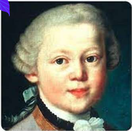
موتسارت در کودکی

اما در سال ۱۷۵۶ میلادی، یعنی همان زمانی که هایدن، جوانی ۲۴ ساله و مشغول به ساخت آثار زیبای خویش بود، اُعجوبه‌ای به نام وُلْفگانگ آمادئوس موتسارت/موتزارت Wolfgang Amadeus Mozart پای بر گیتی نهاد.