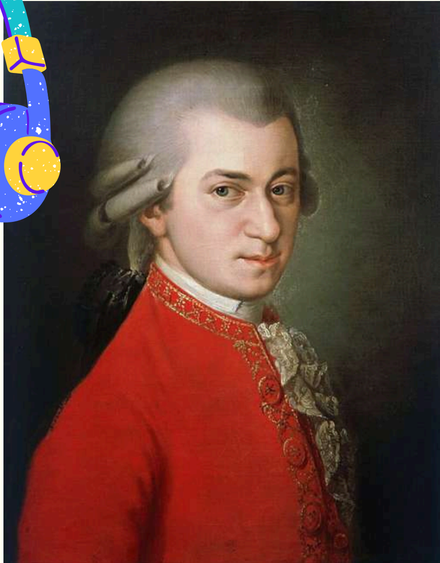
وُلَفگانگ آمادئوس موتسارت در جوانی

یک نکته‌ی مهم در مورد آثار وُلَفگانگ آمادئوس موتسارت این است که نواختنِ برخی ساخته‌های او بی‌نهایت مشکل هستند، به طوری که خود او نیز یک‌بار مجبور شد برای نواختن نُت‌هایی از پیانو که دستش به آنها نمی‌رسید از دماغش کمک بگیرد!