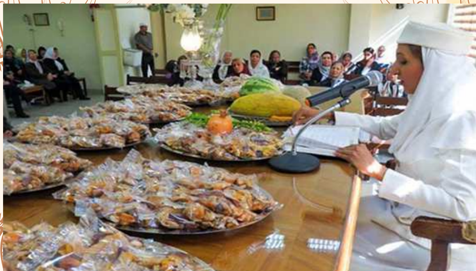
برگزاری جشن آبان‌گان توسط زرتشتیان در ایران امروز

دید و بازدید، جشن و شادی، گستردن سفره‌ی آبان‌گان نیز از دیگر آئین‌های این جشن به حساب می‌آمده است. گل ویژه‌ی آبان‌گان، نیلوفر بوده زیرا این گل به فرشته‌بانو آناهیتا تعلق و پیوستگی داشته است.