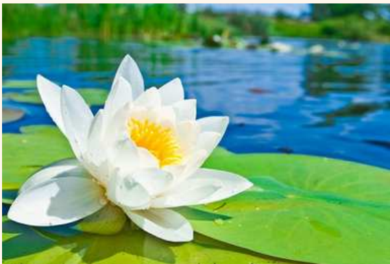
گل نیلوفر آبی

درخشان، نیرومند، زیبا، خردمند، پاک، آزاده و بلندقامت یاد شده است؛ بانویی که کمربندی تنگ بر میان بسته، مویی درخشان تا مُچ پا کشیده دارد، تاجی با صد ستاره‌ی هشت گوش بر سر نهاده و بالاپوشی زرین بر تن کرده است. آناهیتا غرق در زیورهای باشکوه، سوار بر مرکبی با چهار اسب سپید، بر پهنای آسمان می‌تازد و از آب‌های زمین پاسداری می‌کند. در کنار هر رودخانه و دریا نیز کاخی با هزار ستون برای او برپاست.