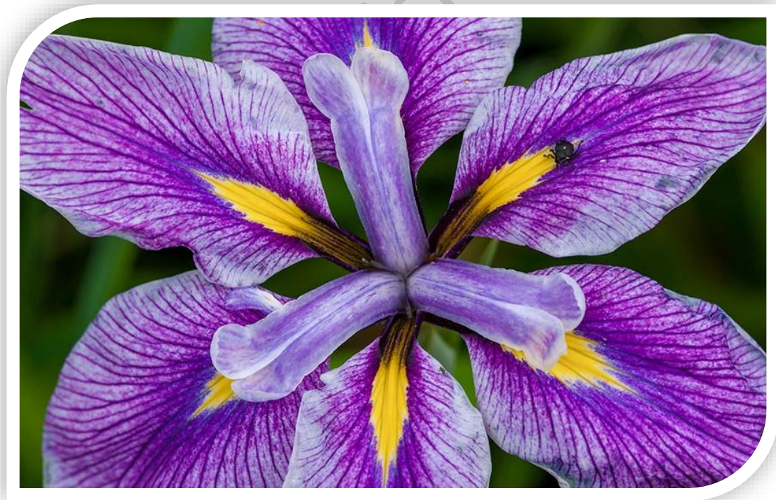
گُل زَنْبَق؛ نمادِ امشاسپند آمداد

(پژوهشی در اساطیر ایران - دکتر مهرداد بهار - چاپ یکم - ص ۱۱۷)